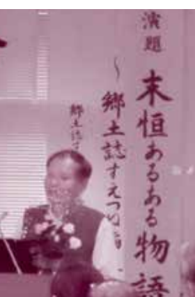
郷土誌すえつね講演会

令和元年度はこれを更に活用すべく郷土誌映像化委員会を立ち上げ、関係機関の協力も得ながら作業を進めています。