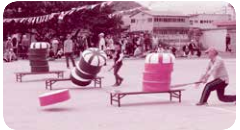
大正地区大運動会

これまでの諸先輩のご努力の成果ですが、それを引継ぎ、次の世代へと渡していこうとされている方々が多くいらっしゃるということも、地区の誇りです。