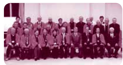
福知山市との交流会

また、毎年十月には二日間に亘つて美保地区文化祭を実施し、住民の皆さんの作品展を開催する他、模擬店の出店、餅つきの実施、老人会の指導で子ども達に昔の遊びを教える等、住民間の触れ合いに務めて地区の一体化を進めて居ますが、災害はいつ起きるか分かりませんから、地域全体でもっと危機感を持って防災のまちづくりを推進する必要がありますと感じています。