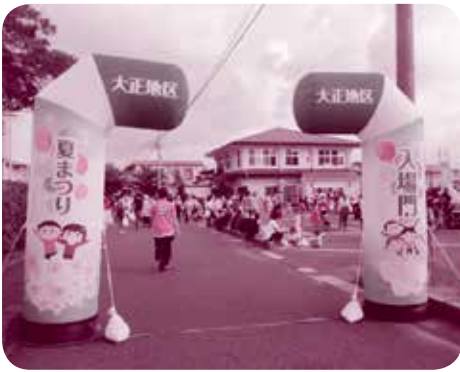
台風を心配しながらの夏まつり