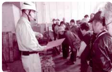
リファレンスいなば

「郷土を愛し、人と自然（環境）にやさしい安心・安全な地域づくり」を目指して、まちづくり連絡協議会と連携して、いやし・ふれあい・あるある探し事業を展開している。