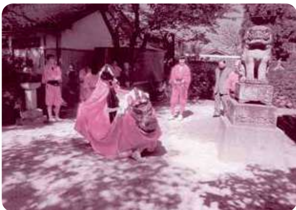
鳥崎神社の麒麟獅子舞

第三に夏場の夕方に防犯パトロールを行っており、地区を東・中・西の三カ所に分けて区長全員が参加して一時間ほどパトロールをしております。近年何事も発生しておらず、安全安心のまちづくりに貢献しております。