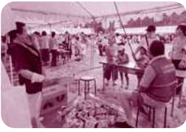
2019年明治地区夏まつり

三つの組織を束ねて、課題にたち向かおうと、市の協働推進課を交えて協議してまいりました。