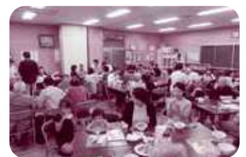
秋の芋煮会（雨天のため屋内）

現在、遷喬地区まち づくり協議会は地区の 課題を 高齢者対策・少子対策・まちのにぎわ い対策 と設定して、この課題に沿った次の三つ の部会