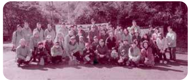
2019年森林ウォークin安蔵

そこでまとまったのが、明治郷づくり協議会を中核とした新たな組織です。公民館運営委員会と郷づくり協