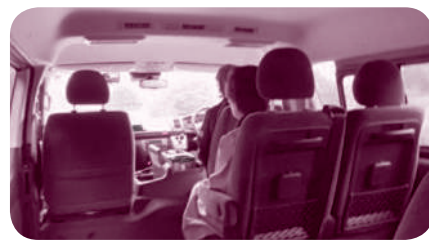
大和ふれあいタクシーの車内

なく、市の公共交通空白地有償運送支援事業補助金事業を活用して、地元住民による運行ができないか検討しました。 しかし、地元による赤字補填と運転手の確保が大きな課題でした。特に、赤字補填は人口の少ない大和では一戸あたりの負担が大きくなり理解が得られませんでした。