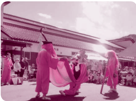
東郷地区公民館まつり

東郷地区は、千代川水系有富川に沿って、南北約八キロ東西二キロに九集落二百八十世帯からなる、山あいののかな田園地帯です。 地区内には東郷工業団地が唯一ありますが、農業が主体の地域であります。平成二十二年三月に策定された東郷地区むらづくり計画は、地域の人が「安心して暮らせるむら」、「住んでよかつた」と誇れるむら、「活力あるむら」の実現であります。小地域だからこそで