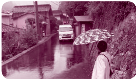
大和ふれあいタクシーを待つお客さん