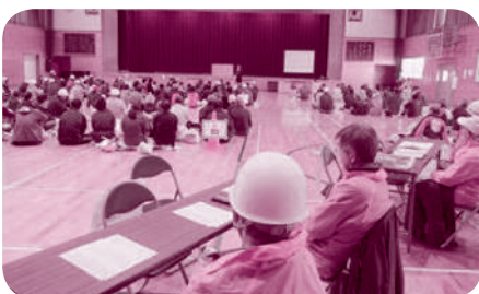
富桑地区合同防災訓練

今後ともみんなの力で各行事の充実を図り、防災に強い富桑、安全・安心な富桑を目指していきます。