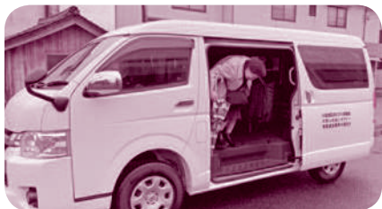
大和ふれあいタクシー部の車

するためには、運転手の確保、利便性、料金等いろいろな課題があります。区長会とまちづくり協議会が協働してのまちづくりを進めています。