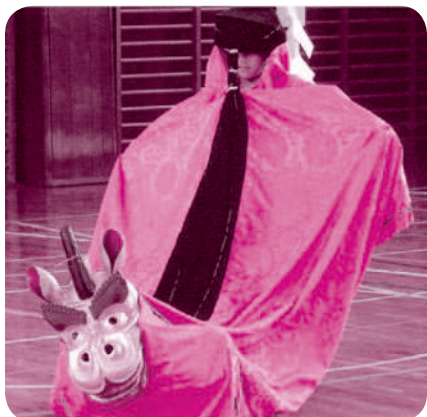
久松小学校児童による公民館まつりでの麒麟獅子舞

ある、ふれあい広場（久松公園周辺）清掃活動を実施しています。各町内から多数の参加があり、親子での参加もあります。久松公園では鳥取市による、国指定史跡鳥取城跡