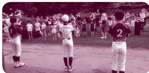
清掃活動終了後の全員でのラジオ体操

今後も住みよい久松地区をつくるために、地区コミュニティの活性化に努めてまいります。