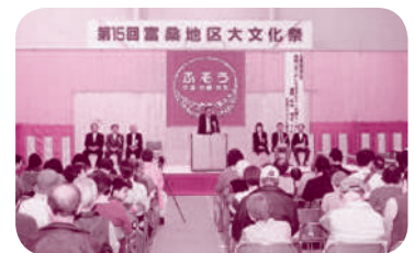
富桑地区大文化祭

主な事業は、五月に地域と小学校と合同の第四十二回富桑地区大運動会を、九月に伝統ある富桑小学校の相