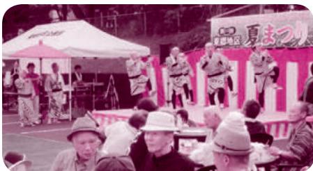
東郷地区夏まつり

きる連帯意識をもって、「むらづくり基本目標」を掲げて、東郷の魅力発信に取り組んでいます。地区敬老会等を通じて、子どもから高齢者まで参加し共に支えあう地域社会の実現を目指す「みんなで支えあう福祉のむらづくり」、地区夏まつり、公民館まつり等を通じて、東郷地区で暮らす一人ひとりが主体性をもって住民相互の交流と地域コミュニティを目指す「活力ある地域コミュニティでむらづくり」、地域総ぐるみで開催する秋季大運動会等を通じて、誰でも参加しやすく健康づくりの機会を提供する「老いも若きも健康づくりでいきいきむらづくり」などに取り組んでいます。 令和四年八月に、可燃ごみ処理施設の神谷清掃工場が東郷地区から移転します。今後の課題は、神谷清掃工場の跡地利用も含めた東郷地区の将来のビジョンづくりです。現在、みんなが主役で、みんなが描く東郷の「未来予想図」を策定しています。少子・高齢化が進む東郷地区の活性化策になればと思っております。