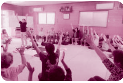
いきいきサロンへの出前講座

そこで、平成二十九年に「あり方検討委員会」を立ち上げ、青谷地区まちづくり協議会の課題を洗い出し、住民のニーズを探るためにアンケート調査を実施することにしました。