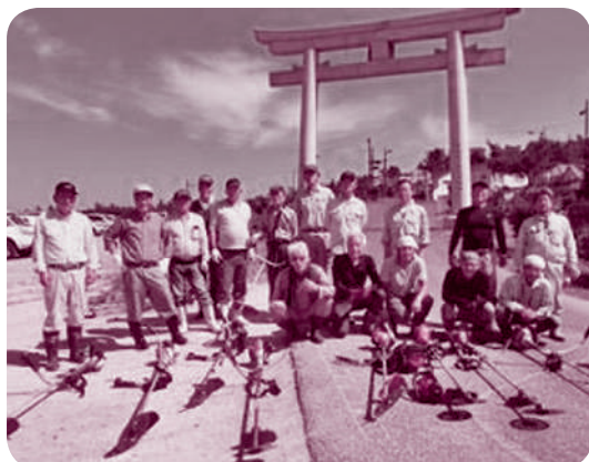
多鯨ヶ池周辺の清掃

的に発足しました。 主な活動としては、多鯨ヶ池周辺の草刈りや水路清掃等の環境整備、子ども農園の開設、弁天宮にトイレの新設、湖畔の老朽化したボート小屋を撤去し、跡地に多鯨ヶ池が一望できる「湖畔デッキ」の設置などを行ってきました。また、平成三十年度からは夏に「多鯨ヶ池手づくりいかだレース」を開催しており、今年も十三チームが六百メートルのコースで競いました。 昨年度は、これまでの活動が評価され、鳥取県が地域を元気にするための県内の優れた地域づくり活動を表彰する「トットリズム活動表彰」の一般部門で優秀賞を受賞しました。 今後も、多くの方に訪れていただき、多鯨ヶ池の魅力を知っていただけるよう、地域ぐるみで取り組んでいきます。