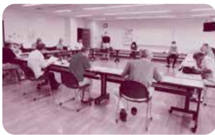
ワークショップの一場面

平成二十九年と三十年の二年間、協議会では、地域の優れた先人五人の功績を学ぶ学習会を、地域の人々を集め、「先人シリーズ」と称し、六回開きました。その後、地域おこしの専門家などのアドバイスをいただき、令和元年に映画づくりへの勉強を行いました。勉強していく中で、鳥取市内に