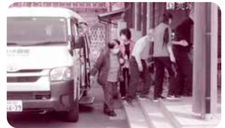
いきいき国英コミュニティバス

国英地区では、本年四月から地区のまち協にあたる「いきいき国英ふるさとづくり協議会」により、地域生活交通を確保するコミュニティバスの運行が開始され、小学生の通学、高齢者の通院、買い物支援などに活用されています。