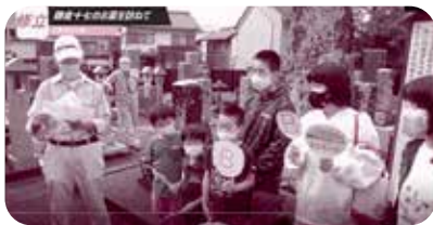
日本最古の力士の墓でクイズに挑戦する小学生

『若者のまちづくり事業』を活用し、環境大学生四名による企画と実行を頂きました。テーマを『今こそ心つながる文化祭への挑戦』とし、GOTO