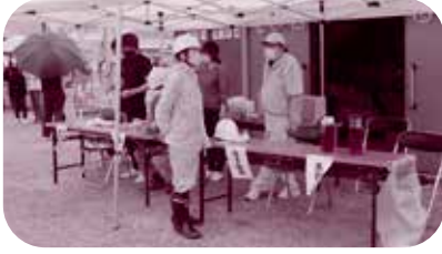
河原地区防災訓練

地域の名所を巡る交流ウォークを開催し、他地区との協働・連携を図る活動に取り組まれています。