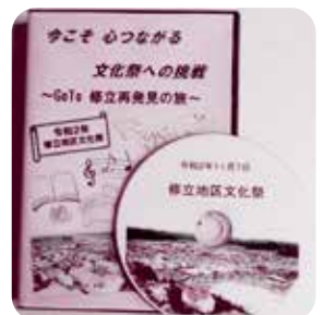
地区の文化祭をまとめたDVD (各町配付)

修立再発見の旅を合言葉に公民館と各町内集会所の四会場をWeb会議で結びます。事前に撮影した団体やサークル紹介ビデオの放映・ゲームなど延べ四百名(YouTube視聴者は更にプラス)の出演者と参加者となりました。正しく、地域の再発見に皆の笑顔が輝き、成功裡に終えることができました。