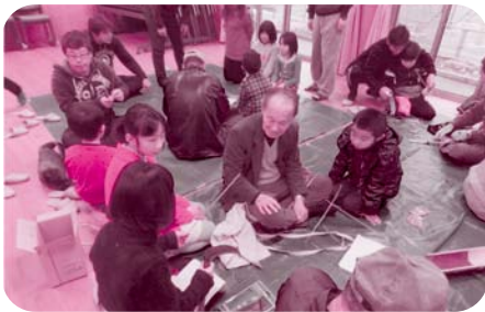
風をあげるための竹ひごづくり

裏方に目をやれば、招待者の何倍もの人達が様々な役を果たしている。その懸命さに感動と感謝。「東郷はすごい」 こども会、PTAの若いスタッフのアイデアは抜群、地区内外の参加者を集め、休耕田を活用した催しで、半端なく泥だらけにしてしまふ。泥おこしで地域起こしするんだからたいたもんだ。