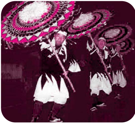
横枕因幡の傘踊り

大和地区は、鳥取道を南に下る時、「ここは鳥取市玉津です」と標識がある一帯七集落二五〇戸余りからなる地域です。