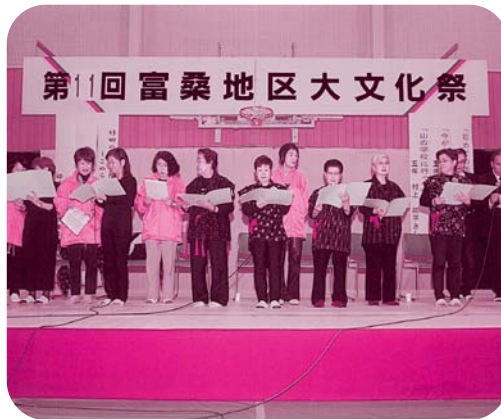
富桑地区大文化祭

歴史と文化を大切にするまちづくり (三)人権を尊重し、弱い立場の人を大切にするまちづくり (四)安全で安心なまちづくりを目標に、自治会をはじめ各種団体の協力を得て、企画委員会です業計画し、「総務部」「健康部」「福祉部」「安全部」の四部で運営しています。