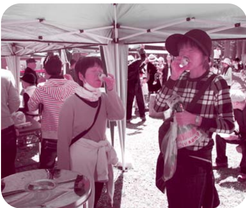
佐治のどぶろくで「どんでん返し」に期待

佐治地区は東西に佐治川と国道四八二号線が平行して走り、国道を挟んで南北に二十七の自治会（集落）が存在しています。東は用瀬町、西は岡山県鏡野町に接し、昔から「佐治谷七里」と言われ細長い谷あいの中山間地です。佐治町では平成六年頃から語尾に「し」がつく地域の特産品等の資源である梨（し）、因州手すき和紙（し）、佐治谷話（し）、佐治川石（し）、さじアストロパークの星（し）の五つの地域資（し）源を活用した個性的な地域づくりに取り組み、平成二十年からは「五しの里さじ地域協議会」を組織して、資（し）源を有機的に結び付けた取り組みを更に積極的に進め、田舎暮らしをテーマとした滞在型観光で元気な地域づくりに取り組んでいます。今年も市街地の小学校二十五校千二百人の児童が民泊や町内で田舎暮らしを体験することになっています。民泊の日には早朝から元気な子ども達の声が地域に響き、私たち大人も元気をいただいています。次年度以降は近畿圏からの教育旅行の受け入れも始まります。しば