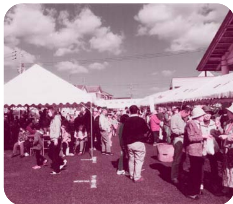
テント村交流バザー

体合同で新春懇話会の実施、三月に各種団体の活動を一冊にまとめた「富桑まちづくりだより」カラー二十ページの広報誌を三年前から発行しています。