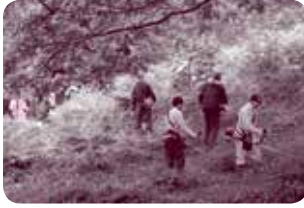
空山広場の草刈り作業

例年なら色々な事業、行事に追われて多忙な日々を送っているはずですが、今年は、年初めから新型コロナウイルスの關係で諸会合、事業も中止となり先の見通しも立たないまま半年が過ぎようとしています。 他地区の自治会活動の状況を聞いて見ますと、自治会総会を一月にする地区と四月にする地区とがあるようですが、津ノ井地区は一月の二十日前後の日曜日に予定しています。年間の大きな行事としては、三月の春分の日に地区慰霊祭、四月二十九日（現在昭和の日）敬老会、七月下旬納涼祭、九月に地区と小学校合同運動会、十一月三日の頃、文化祭と一連の流れの中に他の事業等を組み入れながら年間事業をこなしています。 他地区と違うのは津ノ井小学校が百二十数年間、遠足で登り続けている空山があります。この山の山頂より少し下の所に広場があり、その広場の草刈りを遠足前（四月中旬）に小学校PTAが行い、六月中旬