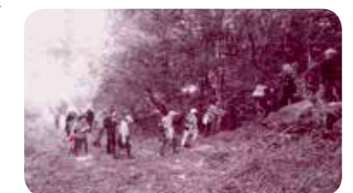
吉岡将監居城跡・箕上山のコース整備と制覇

つり・歴史文化・学校安全・人に優しい・人を育てる・賑わい・安全安心・生活環境・若者の九つの常設委員会を設置し、十六の実施計画に基づいて各委員会が活動を推進しています。