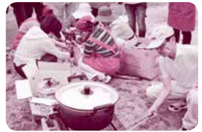
災害時での炊き出し訓練

ています。また「環境美化」では、ポイ捨て一掃大作戦と銘打って千代水地区の清掃、集会所や公民館に花を飾る庭先花いっぱい運動の展開等行っています。さらに「健康福祉」では、毎年九月に千代水カップ体育の祭典という運動会を開催しており、校区が三つに分かれている地区なのでこの運動会を楽しみにしている人が多いです。この運動会の種目の中で縄ない競争は、お年寄りの方が子どもたちに縄のない方を教える様はとても微笑ましく好評です。最後に「歴史文化」では、地区の名所旧跡等を歩いて探索したり、地区に残る安長麒麟獅子舞や千代水荒神神楽等の発表交流会の実施や、しゃんしゃん祭の傘踊り参加等、地区の文化の保存、継承に努めています。以上、五部会で活動しています。他地区と同様、事業のマンネリ化、参加者の減少傾向もあり、いろいろ工夫しながら少しずつ改革しなければならぬと思っています。特に地区は校区が三つに分かれている為の苦勞等がありますが、計画の目標である「人とひとがつながり夢のある住みよいまち」ちよみになるよう地域コミュニティの活性化に努めてまいりたいと思っています。